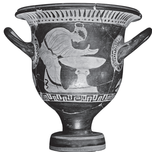
Fig. 1. Crátera de campana ática de figuras rojas (procedente de Beocia), del último tercio del siglo V a.C. Museo del Louvre (nº inventario CA1341): 'mujer lavándose/haciendo sus abluciones en un louterion '.

muebles o constructivos. La gran variabilidad morfológica que se observa en las representaciones artísticas o en los mismos inventarios materiales supone seguramente otro de los hándicaps para su correcta identificación. Esa misma variedad de formas y proporciones, aún a pesar de su rareza en los contextos arqueológicos, ha de obedecer a cuestiones tales como el ámbito cultural en que se desenvuelve o su cronología, haciendo aún más complejo el análisis, sin que por ello carezcamos de intentos de sistematización (Iozzo 1981; Nardi 1991; Fergola y Scatizza 2003).